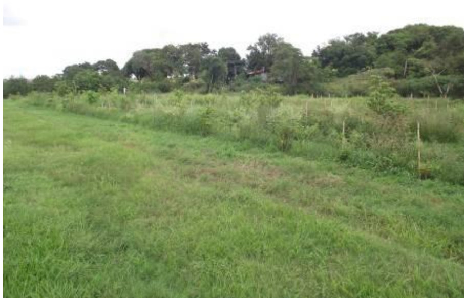
“Bosque do Futuro” 5, localizado na Rua Niterói, no Jardim São Jorge.

Fotos tiradas dos locais em Fevereiro de 2012