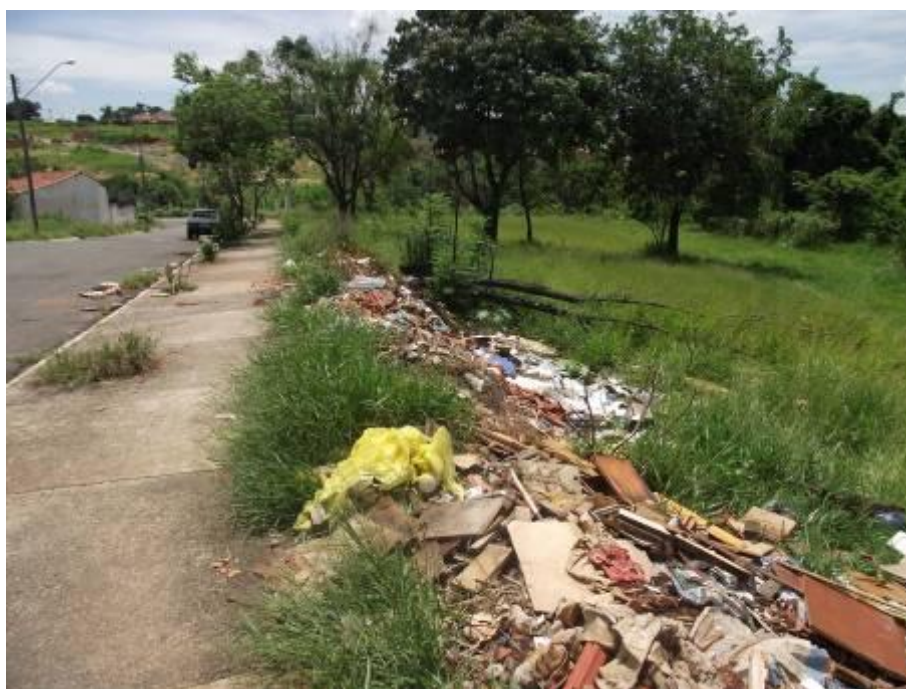
“Bosque do Futuro” 4, localizado na Rua das Acácias, no Jardim das Palmeiras.