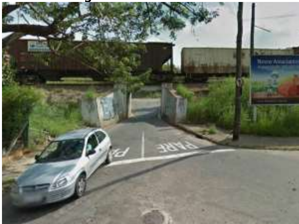
Imagens do local em Nova Odessa