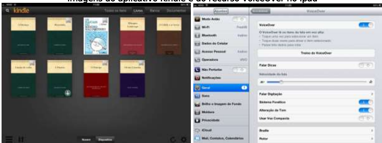
Imagens do aplicativo Kindle e do recurso VoiceOver no Ipad