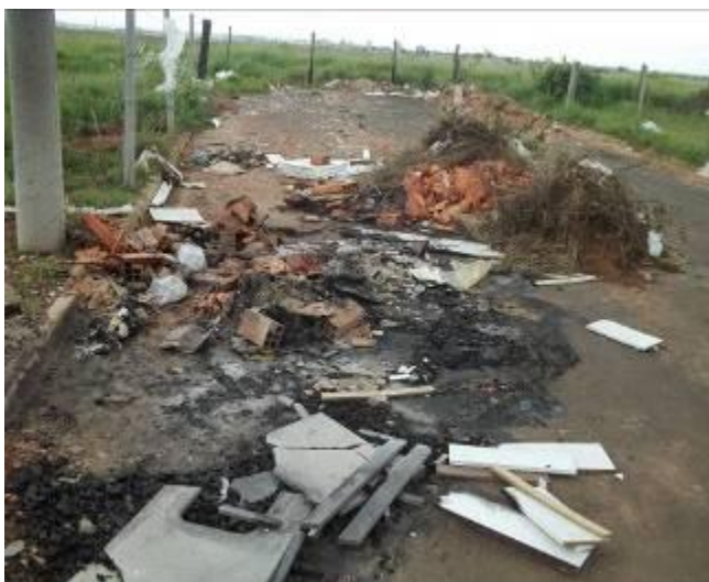
Rua Pastor Claudio Almeida