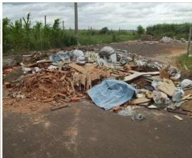
Rua Alcides Gonçalves Sobrinho