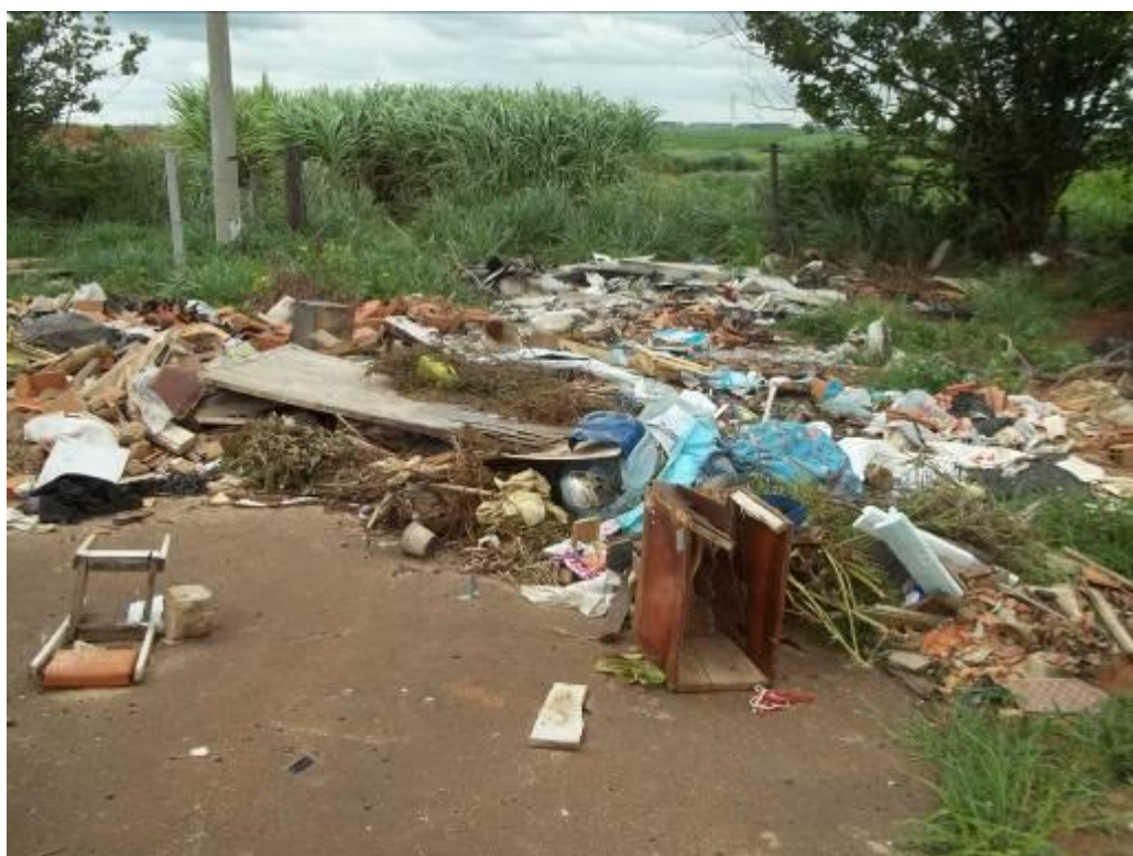
Rua Vhelmes Rosembergs