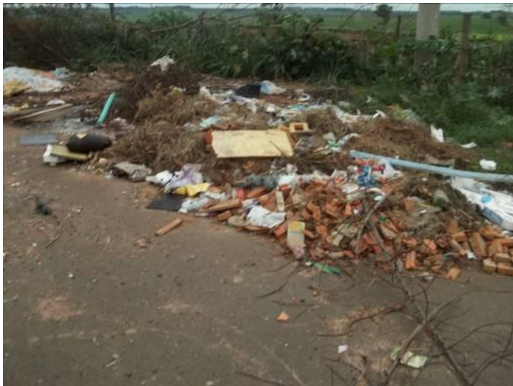
Rua Joaquim C. de Oliveira