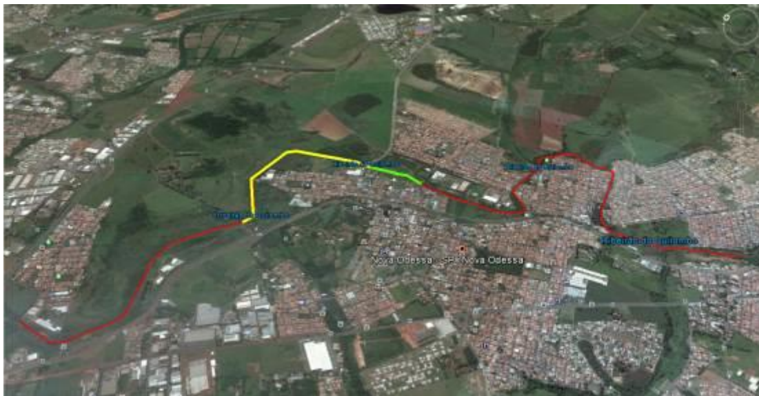
Trecho do Ribeirão Quilombo que passa por Nova Odessa.

Legenda: Vermelho: Trecho total do Ribeirão em Nova Odessa (aprox. 9,4 Km). Amarelo: Trecho de aprox. 2 Km desassoreado entre 2004 e 2012. Verde: Trecho de aprox. 0,5 km desassoreado entre 2013 e 2014.